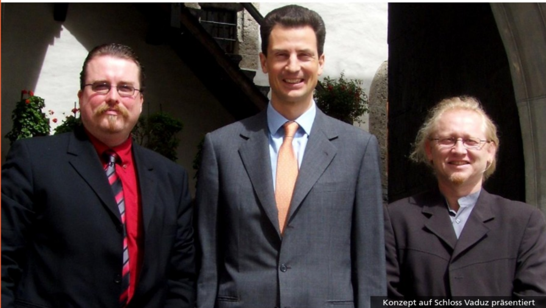
Konzept auf Schloss Vaduz präsentiert